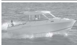
Merry Fisher 705