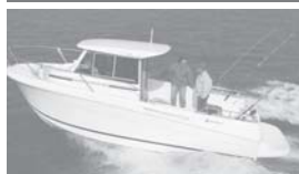
Merry Fisher 655 marlin