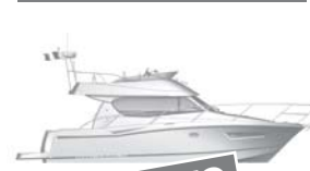
Merry Fisher 10