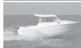
Merry Fisher 725