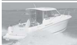
Merry Fisher 655