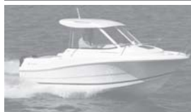
Merry Fisher 585