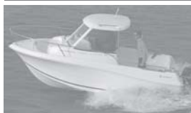
Merry Fisher 585 marlin